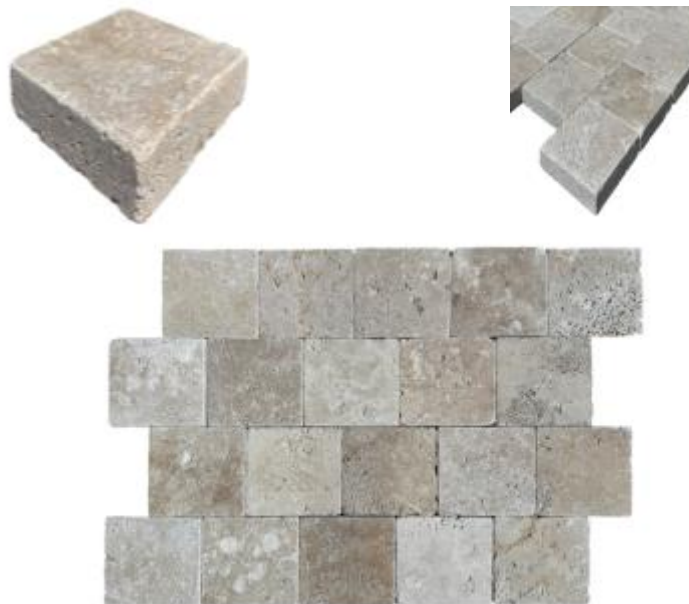
Εικόνα 1,2 και 3. Φυσικός κυβόλιθος τραβερτίνο.

Προτείνεται η επίστρωση με φυσικούς κυβόλιθους , στη νοτιοδυτική γωνία του αρχαιολογικού χώρου, όπου πρόκειται να διαμορφωθεί μια μικρή περιοχή στάσης και ανάπαυσης των επισκεπτών. Ο τύπος του εν λόγω υλικού θα είναι φυσικός πωρόλιθος, Τραβερτίνο Αντίκ (travertine) με προτεινόμενες διαστάσεις 15,25X15,25X6 - 10εκ. (πάχος).